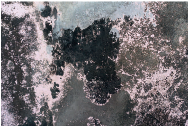
Das Ergebnis eines Wasserschadens mit Schimmelfall: Verschiedene Pilzgattungen und -arten überziehen mit ihren farbigen Fruchtkörpern die Wand und streuen Sporen