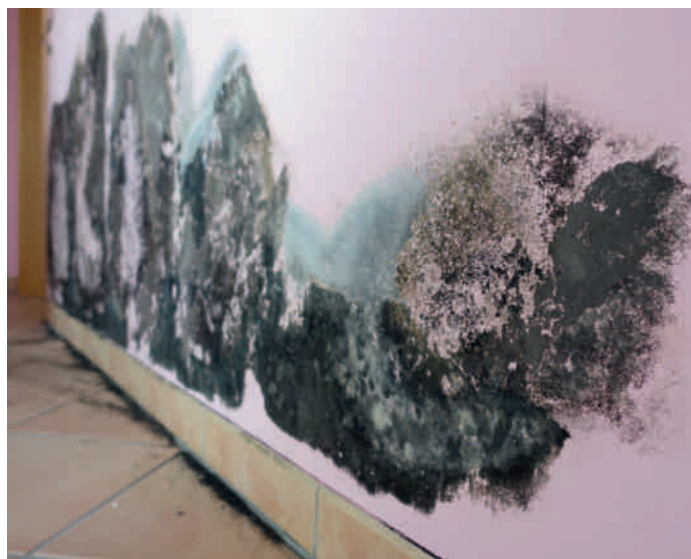
Bei der Beurteilung von sichtbarem Schimmelpilzwachstum müssen neben der Fläche des Schadens auch die Tiefe und Art des Befalls berücksichtigt werden. Schon ab einer flächigen Ausdehnung von mehr als 0,5 Quadratmetern wird der Befall mit der höchsten Kategorie 3 bewertet